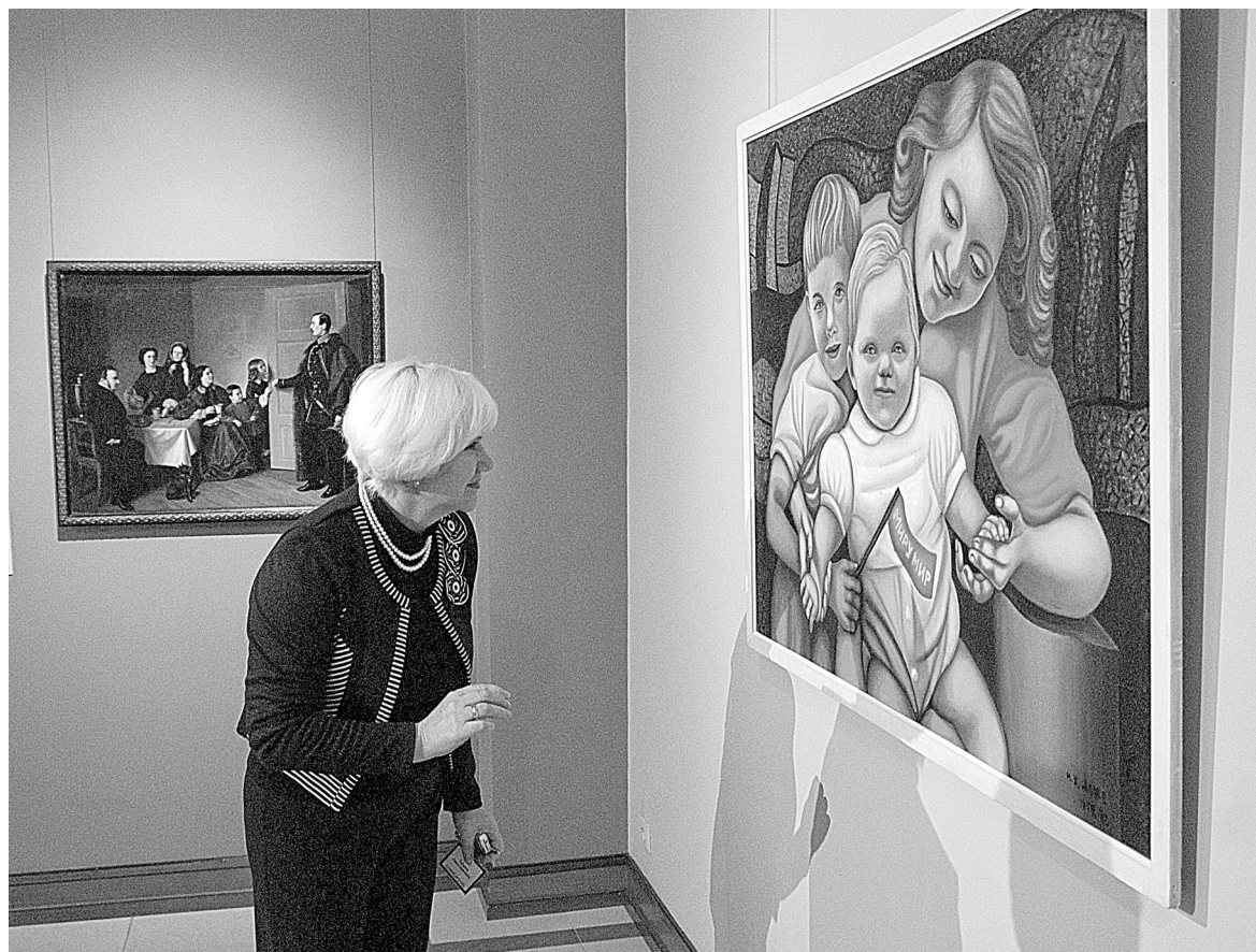
В Белгородском художественном музее состоялось открытие выставки «В кругу семьи», из собрания Государственного музея изобразительных искусств имени А. С. Пушкина. В экспозицию вошли 50 произведений живописи и скульптуры, в основном западноевропейских художников XVI—XX веков, так или иначе связанных с «семейной» тематикой.

В ДЕНЬ Андреевского флага, который официально празднуется 10 декабря, по инициативе воронежского филиала «РТ» состоялся торжественный подъем морских штандартов. В Воронеже в церемонии приняли участие воспитанники местного кадетского корпуса. Кроме того, аналогичные мероприятия прошли в селе Таврово и райцентре Рамонь, а также в Суздале Владимирской области.