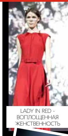
LADY IN RED - ВОПЛОЩЕННАЯ ЖЕНСТВЕННОСТЬ

7 декабря, Event-Hall, презентация новой коллекции Татьяны Сулиминой