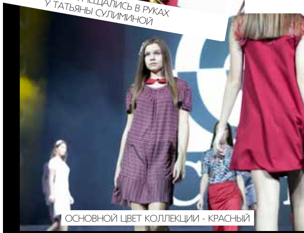
ОСНОВНОЙ ЦВЕТ КОЛЛЕКЦИИ - КРАСНЫЙ