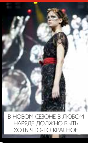
В НОВОМ СЕЗОНЕ В ЛЮБОМ НАРЯДЕ ДОЛЖНО БЫТЬ ХОТЬ ЧТО-ТО КРАСНОЕ