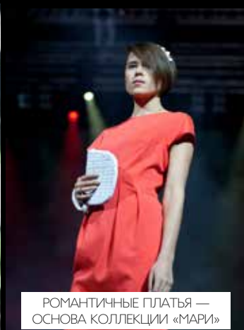
РОМАНТИЧНЫЕ ПЛАТЬЯ — ОСНОВА КОЛЛЕКЦИИ «МАРИ»