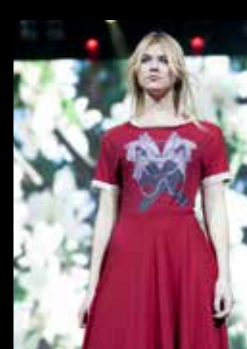
КРАСНЫЙ ЦВЕТ — ТРЕНД СЕЗОНА