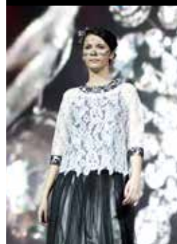
ЧЕРНЫЙ И КРУЖЕВО — ЭЛЕГАНТНОСТЬ НАВСЕГДА